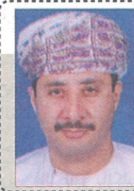
مشروع الكليات التطبيقية وأرق التفاصيل ..!