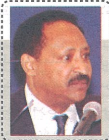
العمانيون في الصين: تجار ووزراء !!