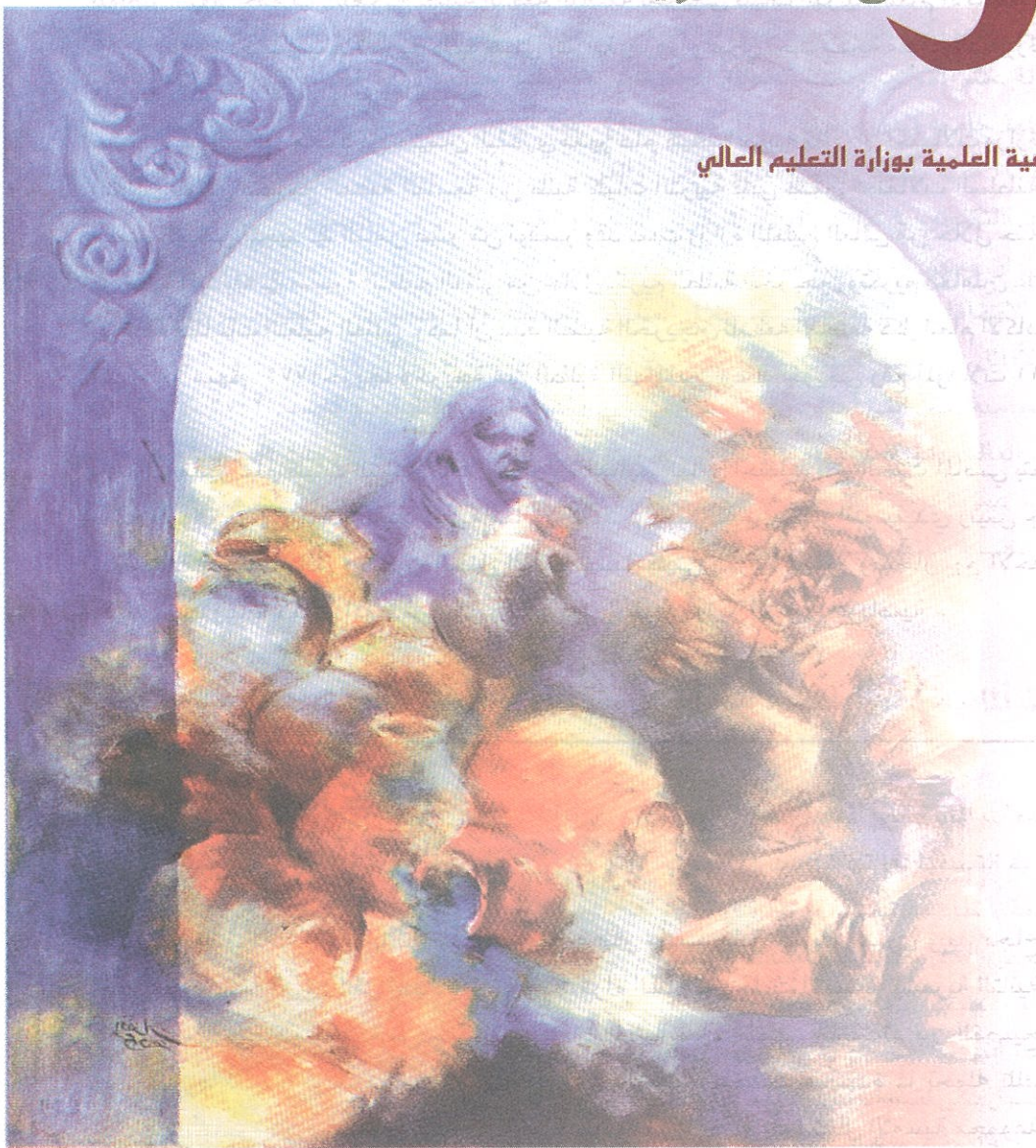
اللوحة للفنانة: افتخار البدوي

تصدره جريدة عمان بالتعاون مع دائرة التوعية العلمية بوزارة التعليم العالي