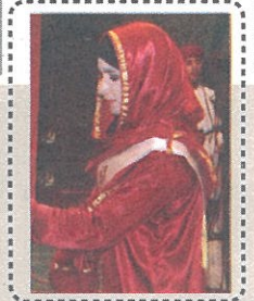
تواصل تخريج الدفعة التاسعة