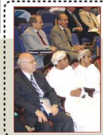
حلقة عمل حول استراتيجية إدارة الجودة