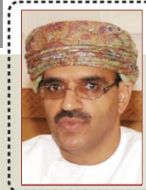
تدشين موقع الملحقية الثقافية في الهند