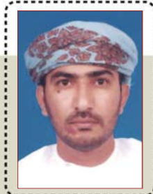
الإرتباط الأكاديمي .. ضبط أم ربط؟!