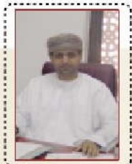
3 معرض لمؤسسات التعليم العالي الهندية