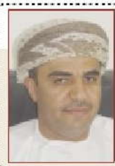
5 الطالب هو العنصر الأساسي