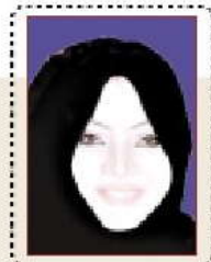
7 استطلاع حول مركز القبول الموحد