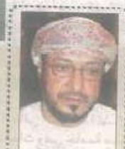
تأسيس رابطة للجامعات والكليات الخاصة