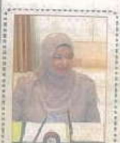
اجتماع مجلس الكليات يناقش الندوات