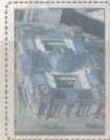
في ألمانيا الأثة ليمت عالقا