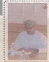
اجتياهم للطهقين التقائمين