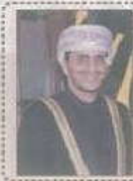
الحارثي : ممتون الطلاب السمائي جيه