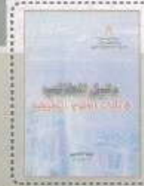
إصدار دليل الطالب في صفيات العلوم التطبيقية