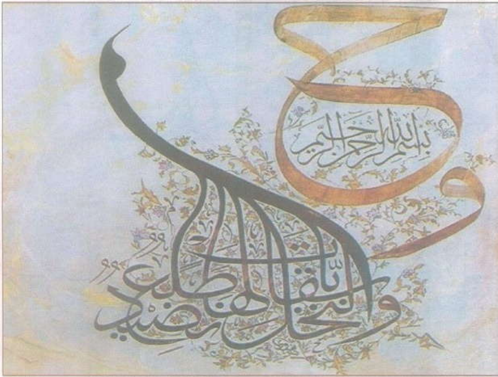
اللوحة للفنان: سامي الغاوي

تصدره جريدة عنان بالتعاون مع دائرة التوعية العلمية بوزارة التعليم العالي