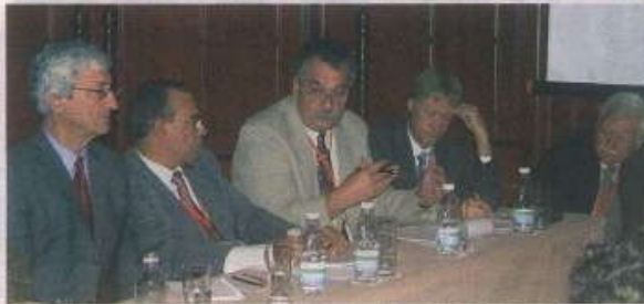
الهداية في تأسيس ثقافة الإبداع والبحث العلمي منذ نعومة الأظفار من المرحلة الابتدائية وليس فقط بعد المرحلة الثانوية. وبالإضافة إلى ذلك فنحن في حاجة إلى موارد للبحث العلمي ليس ترحيا وإنما هو استثمار وسوف يأتي منه خير كثير.

وأما بالنسبة للصعوبات فتقول ليست هناك صعوبة في تطبيق ما طرح ولكن لتبدأ أولا بحل مشكلات الواقع والتعامل معها وبصورة تدريجية ولا نتطلع إلى الخارج من أول الأمر ثم نضع الإستراتيجية ولكن على