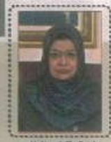
وزيرة التعليم العالي سلطنة بروناي