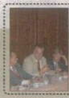
استراتيجية البحث العلمي للسلطنة

مؤرخة الإمارات العربية المتحدة د. هيلمة بنت عيسى تحدثت في مؤتمر العلماء في جامعة الأمم المتحدة في نيويورك في شهر نوفمبر 2007م عن دور المرأة في التعليم العالي في الإمارات العربية المتحدة.