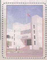
حتمية إعادة هندسة المنظمات التعليمية المعاصرة