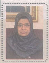
وزيرة التعليم العالي تشارك في اجتماعات الكومستك