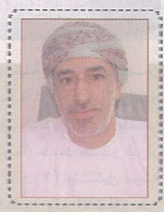
بدء التسجيل بالتقريب الموحد

تتعاوننا مع وزارة التعليم العالي والبحث العلمي، وذلك من خلال تنفيذ برامج تدريبية متخصصة، وإجراء أبحاث علمية في مجالات التعليم العالي، مما يساهم في تطوير العملية التعليمية، ورفع مستوى الكفاءات العالمية.