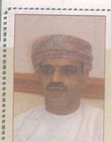
وكيل التعليم العالي يزور الجامعات الفنلندية والسويدية