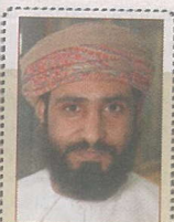
الطريق إلى المكتبات الإلكترونية