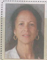
لقاء مع السفارة الفرنسية