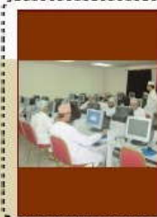
استضافة ١٥ طالبة ماليزية بكلية الرستاق