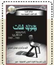
انطلاق فعاليات الأيام المسرحية لكليات العلوم التطبيقية الأسبوع القادم