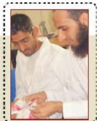
الفصل الصيفي .. ماله وما عليه!