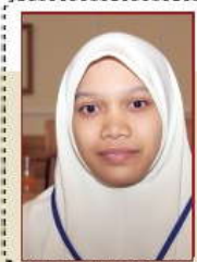
التبادل الطلابي يوثق الترايط بين ماليزيا والرساق